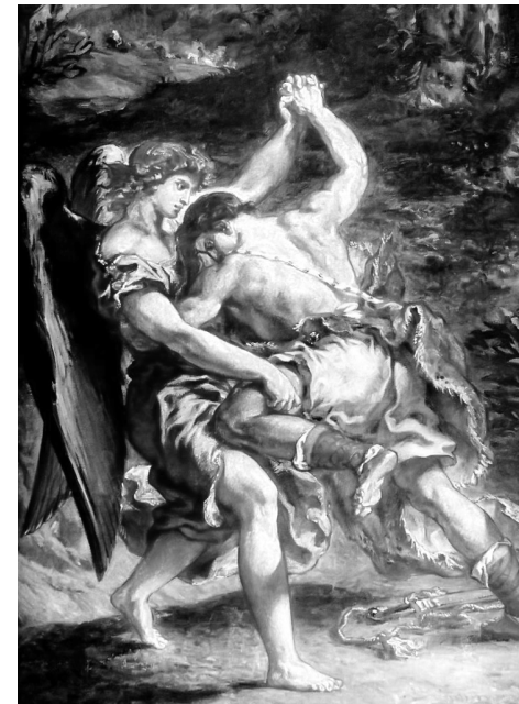
Jakubov zápas s neznámym protivníkom od Delacroixa

Keď sa Jakub dozvedel, že Ezau k nemu prichádza so štyristo mužmi, zľakol sa a bolo mu úzko. (32,8) Úprimne volá k Bohu a prosí o ochranu. V tú noc (snáď vo sne – sen v Biblii často býva miestom Božieho navštívenia) Jakub zápasí pri potoku Jabok so záhadnou bytosťou. Neskôr Jakub túto postavu identifikuje ako Boha. Rovnako aj Abrahám nespoznal hneď v počestných samotného Pána.