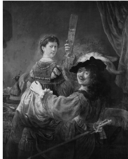
Rembrandtov Návrat márnotravného syna , ktorý namaloval ako tridsaťročný

Ako mladík mal Rembrandt všetky vlastnosti márnotravného syna – bol bezočivý, sebavedomý, zmyselný a arogantný. Aj ako tridsaťročný namaloval seba ako márnotravného syna – ako opitého, plytkého, s pootvorenými ústami a s očami bažiacimi po zmyselnosti a pôžitku. V pravej ruke drží poloprázdny pohár a ľavou rukou drží v páse svoju milú, ktorá má taký istý zmyselný pohľad ako on. Zatiahnutý záves dáva tušiť, že scéna sa odohráva v niektorom z verejných domov vo vykričanej štvrti Amsterdamu.