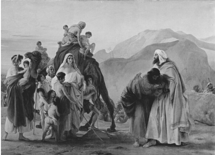
zmierenie Jakuba s Ezauom v Kanaáne od Francesca Hayzesa

Predtým, ako prežil Jakub tento nočný boj so samotným Bohom, nechal Jakub kráčať